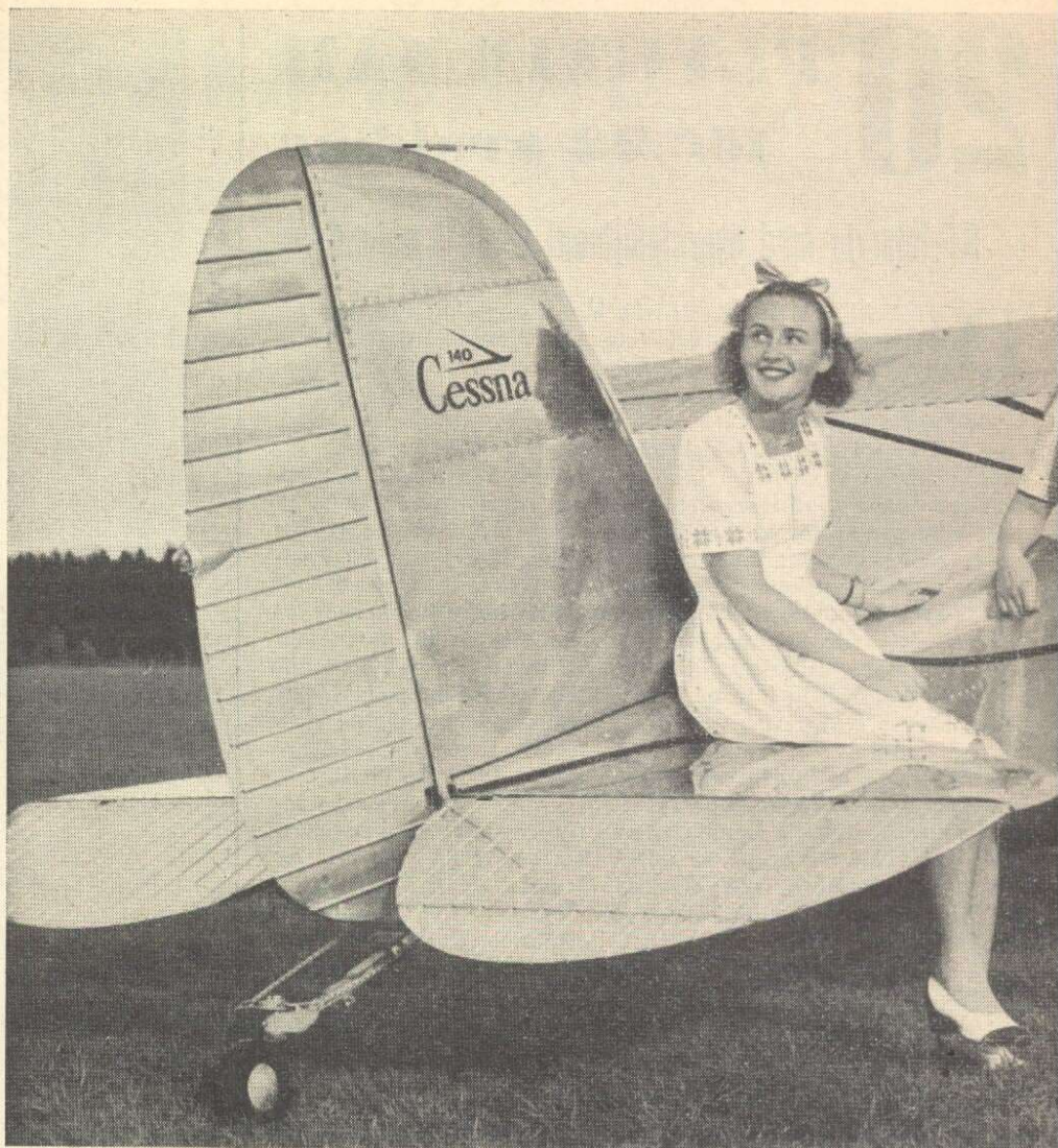
Gösta Forslund vore inte Gösta Forslund, om han inte till Cessnas europapremiär hade näst Säg vem som s