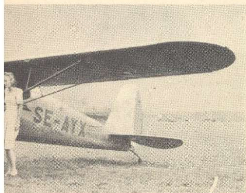
fält", berättar Gösta Forslund för en inrullat fram — American Stile!

Det finns strängt taget två versioner av Cessnas sportplan — Cessna 120 och Cessna 140 — och det är den senare av de två, lyxversionen alltså, som kommit hit med sitt första exemplar. Medan Forslund har för avsikt att hålla priset på Cessna 120 under 20.000 kr, har priset på Cessna 140